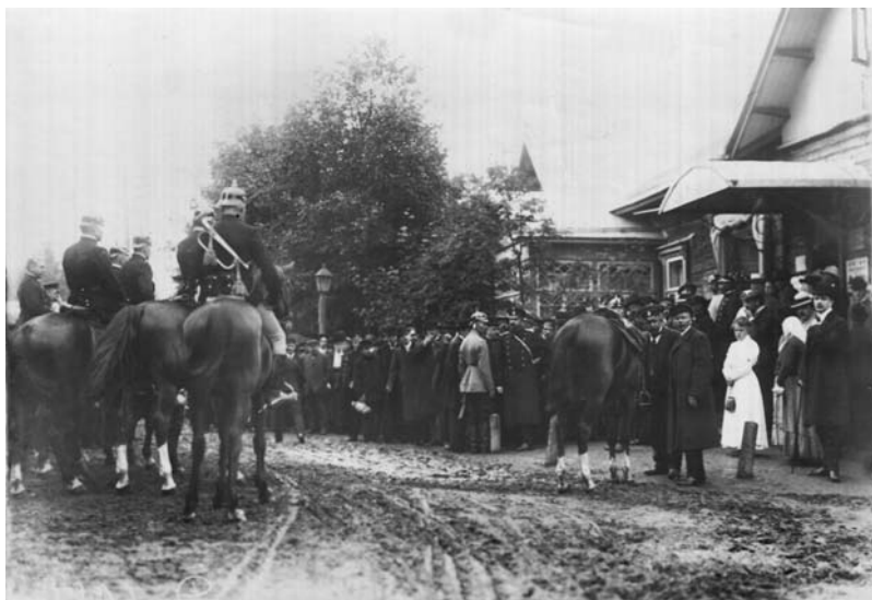
Териоки утром 12 августа 1909 г., перед заседанием суда.