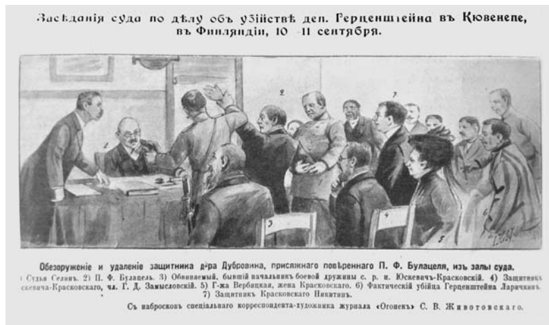
Рисунок из журнала «Огонек» от 19 сентября 1909 г.

И тут неистовый черносотенец, крича, что не даст финляндцам арестовать себя, извлек из кармана револьвер. Полицейский офицер выбил оружие у него из рук, после чего распоясавшийся адвокат был силой выведен из зала суда. Заседание возобновилось, и в качестве компромисса судья разрешил Замысловскому сменить Никитина в том случае, если тот почему-либо не сможет продолжать защиту Юскевича-Красковского. Павел Булацель более на суде не появлялся. 192