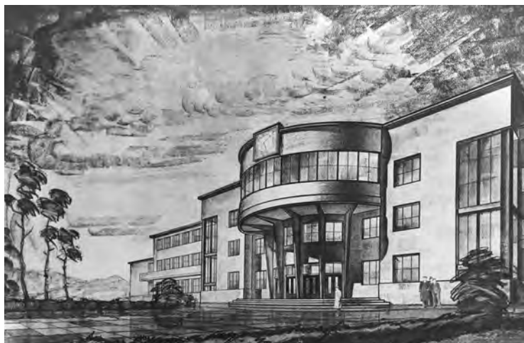
Н. Ф. Демков. Дом культуры имени Кирова в Мурманске. В соавторстве с Н. А. Митуричем, В. П. Макашовым. 1930. Фотокопия. ЦГАЛИ СПб.

Критика конструктивизма и возвращение к наследию исторических стилей после 1932 года, конечно, отразились в творчестве Николая Александровича Митурича. Изменения произошли быстро, но нельзя сказать, что они оказались внезапными. Тяга к монументальности и поиску величественного образа заметна уже в его работах начала 1930-х годов, например в проекте Дома культуры имени С. М. Кирова в Мурманске (открыт в 1932 году). Симметричная уравновешенная композиция главного фасада акцентирована большим полукруглым эркером над входом. Ритм бетонных консольных ребер, поддерживающих выступающий объем, напоминает о колоннаде, которая могла в этом месте оформлять классический полукруглый портик, но использование ее показалось бы в 1930 году неуместным.