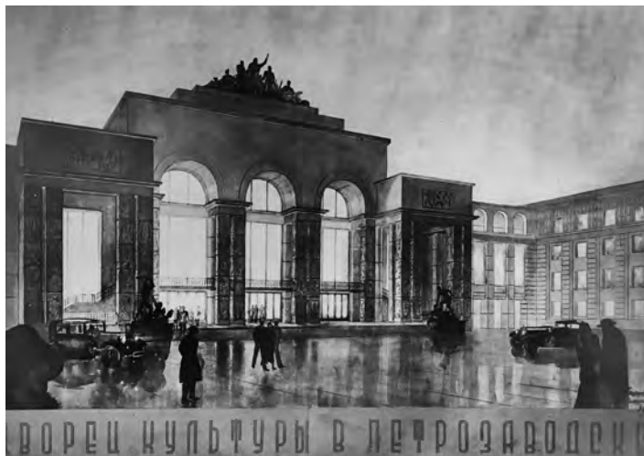
В. П. Макашов. Дворец культуры в Петрозаводске. В соавторстве с Н. А. Митуричем и В. К. Крыловым. 1934. Фотокопия.